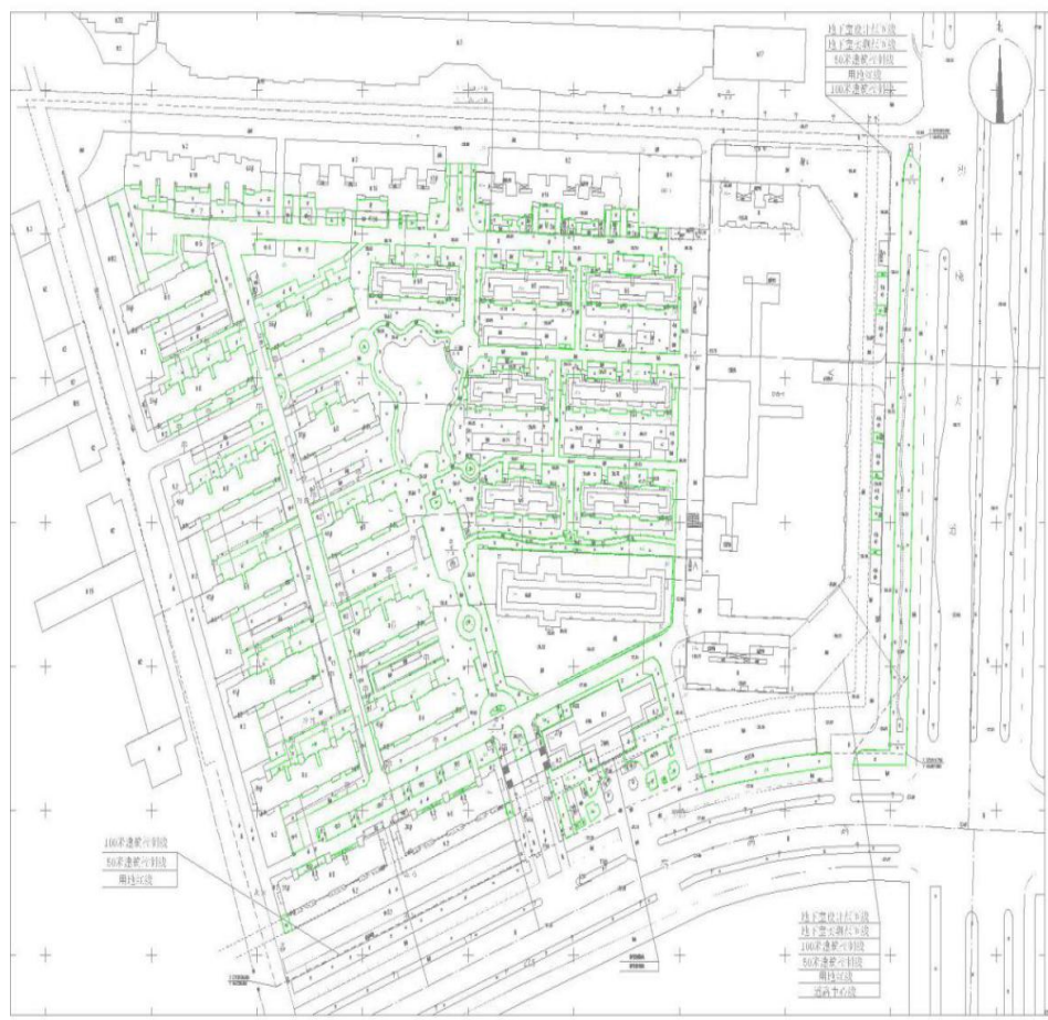
竣工实测绿化布局图 (绿地率 28.57%)

注:所有反馈意见必须注明真实联系人姓名、联系电话、联系地址、如信息不准确或不完整无法及时进一步核对有关情况的视为无效意见。